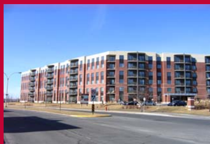
Jazz Drummondville sur le boulevard René-Lévesque

Le vieillissement de la population touche le Québec en entier et Drummondville ne fait pas exception à la règle. Selon les données démographiques de 2006, les 45-49 ans font partie du groupe d'âge le plus important en nombre. Si on décortique la pyramide des âges, on constate qu'il y a 37 % de la population drummondvilloise qui se situe entre 40 et 59 ans et 21 % chez les 60 ans et plus.