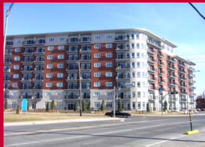
Les Terrasses de la fonderie au coin des rues Saint-Georges/Hébert.